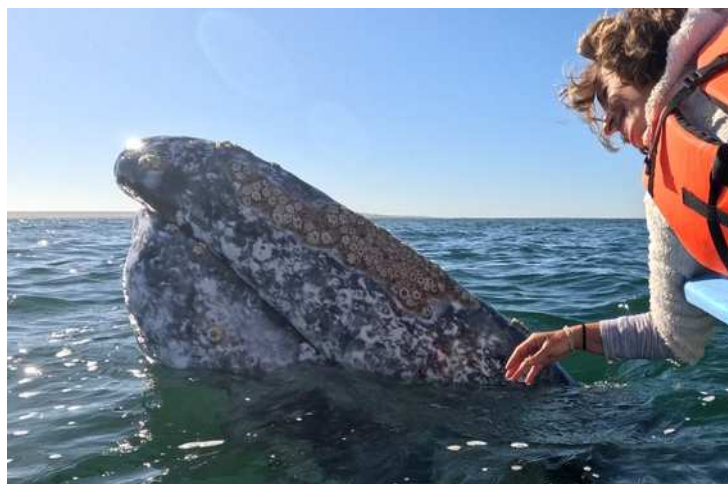
Le requin baleine à La Paz et la baleine grise à Guerrero Negro, une biodiversité unique !

Côté terre, une seule route, la trans péninsulaire, traverse des étendues sauvages immenses où règnent les cactus, au milieu d'une chaîne de montagnes dont le sommet culmine à 3100 m et au bord d'immenses plages baignées d'eaux turquoise. Il s'en dégage une énergie très particulière, hors du temps, qui invite à l'aventure, à l'humilité face à la vastitude et à la beauté de Mère Nature.