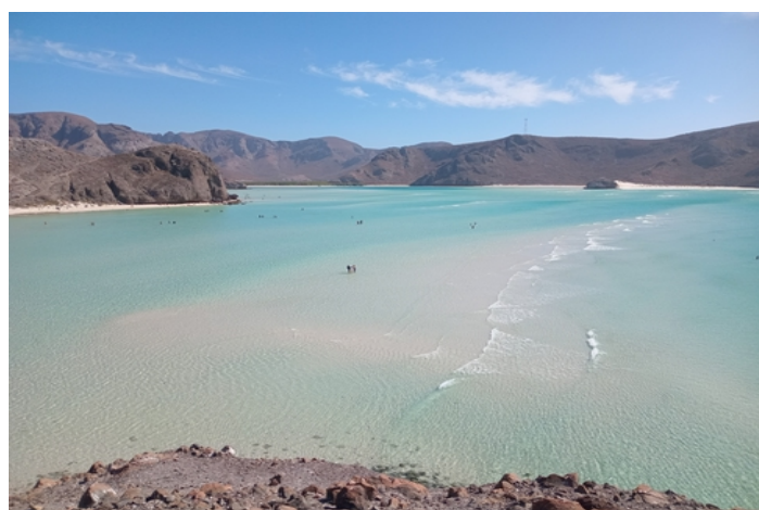
Le baiser de la baleine grise à Guerrero Negro et la baie de Balandra.