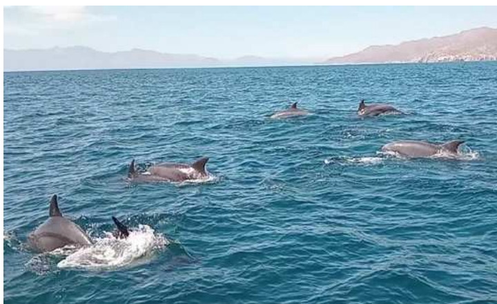
La plage El Tecolito et un banc de dauphin prêt à vous éclabousser à Loreto.