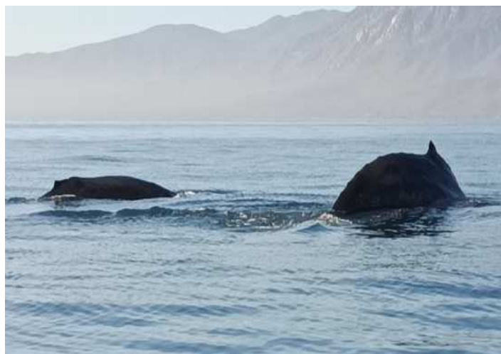
La danse des otaries à l'île Coronado et une mère baleine à bosse accompagnée par son petit à Loreto .