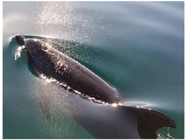
La baleine bleue et le grand dauphin vous attendent à Loreto.

Durant ce séjour, je tisserai des ponts entre mes connaissances scientifiques de biologiste marine et mes perceptions subtiles. Je partagerai ma vérité, guidée par nos JE SUIS* réunis, dans l'instant présent.