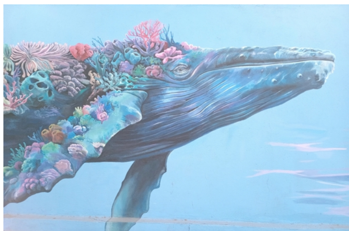
La statue vibrante du malecom de La Paz et une peinture murale.

J'avais alors 40 ans et une nouvelle vie commençait : j'ai quitté mon travail de scientifique, ma maison à Moorea et j'ai ressenti l'appel des dauphins d'Hawaï . Je suis partie plusieurs mois les rejoindre pour continuer mon apprentissage de Divine humaine auprès de mes frères et sœurs marins . Chaque matin j'étais dans l'eau avec eux, entourée parfois d'une centaine de dauphins. Ils me scannaient, me soignaient, jouaient avec moi... Les premiers jours, je pleurais de joie dans mon masque et tous les après-midi, j'allais dormir pour intégrer l'intensité de ce que je vivais ! C'est à ce moment-là que j'ai reçu ce message intérieur, comme une évidence, pour me guider sur ce que j'avais à partager dans ce monde : « Je suis le souffle de la baleine, le chant du béluga, la joie du dauphin et je participe à l'ouverture des cœurs humains » .