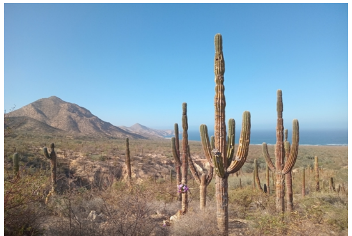
Un coucher de soleil flamboyant et le roi des cactus autour de La Paz.